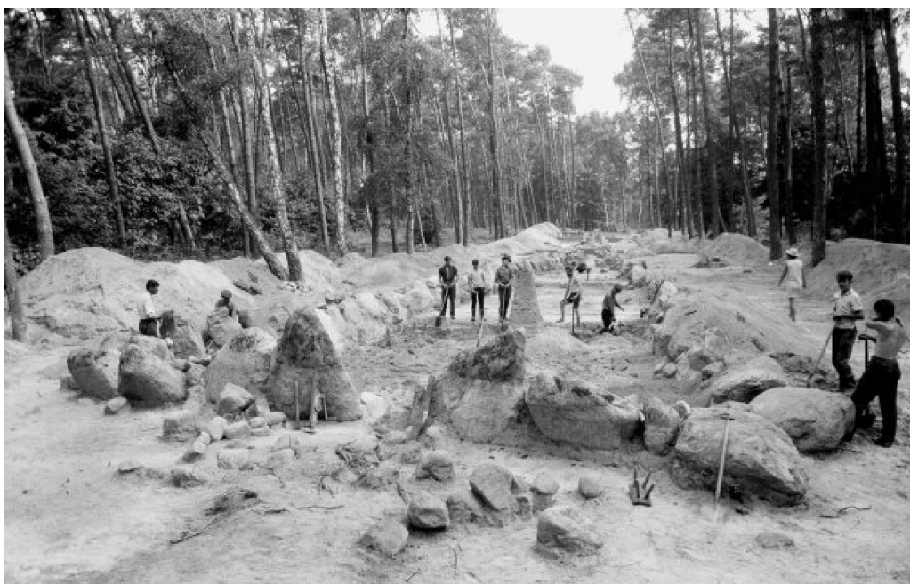
Fot 1: Archiwum Muzeum Archeologicznego i Etnograficznego w Łodzi.

Ale od ponad stu lat nad piramidami ciąży fatum. Czy w końcu uda się je odwrócić?