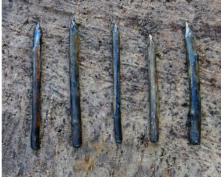
Ostrza cisowe znalezione nad jeziorem Świdwie.

Kolejne ślady świadczące o praktykowaniu obrzędów przed 9 tysiącami lat w Bolkowie nad jeziorem Świdwie na Pomorzu Zachodnim odkryli archeolodzy z Instytutu Archeologii i Etnologii PAN w Szczecinie.